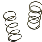
90901 5 Knopffedern