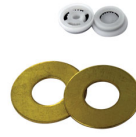
90192 5 Durchflussmengenregle r 8 l/min