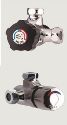
BC : Bouton laiton chromé BN : Bouton noir